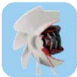
Brushless μοτέρ υψηλής απόδοσης χαμηλής κατανάλωσης με δυνατότητα ρύθμισης