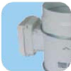
Ενσωματωμένες ηλεκτρονικές συνδέσεις